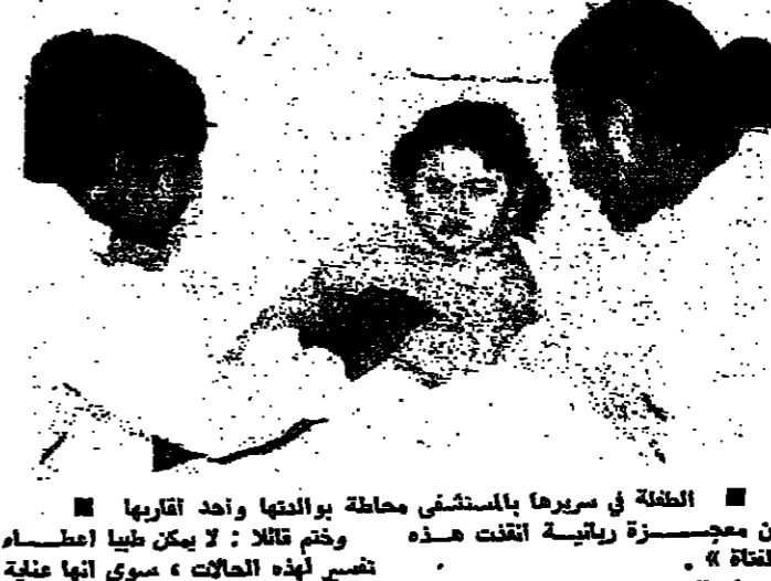
الطفلة في سريرها بالمستشفى محاطة بوالدها وواحد اقربائها ان معجزة ربانية اتخذت هذه الطفلة في سريرها بالمستشفى محاطة بوالدها وواحد اقربائها